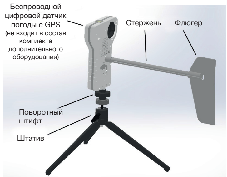
Флюгер и штатив для беспроводного датчика погоды с GPS. На рисунке показан датчик PS-3209 (не входит в комплект)